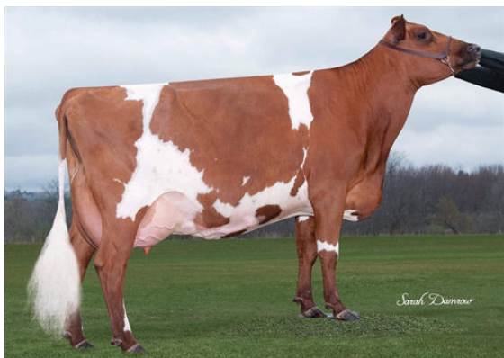
LA SAPINIERE CHELYO