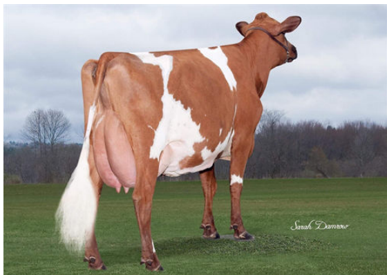
LA SAPINIERE CHELYO